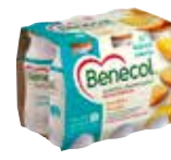
60119 Benecol Jogurttijuoma Persikka 6 x 100g