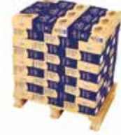
85504 Elovena Kaurahiutale puolilava 72x2kg