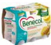
60120 Benecol Jogurttijuoma Sitruuna, hunaja & inkivääri, 6x100g, ME 4