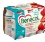
60117 Benecol Jogurttijuoma Mansikka 6 x 100g