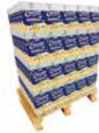
81401 Elovena Kaurahiutale puolilava 140x1kg