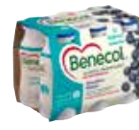
60118 Benecol Jogurttijuoma Mustikka 6 x 100g