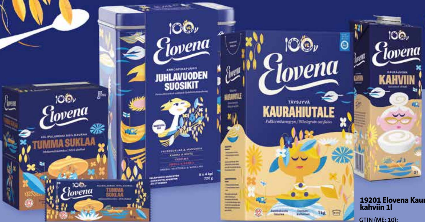
81652 Elovena Välipalakeksi Tumma suklaa 10x30g

JUHLAVUODEN VERKKOKAUPPA AVATAAN TAMMIKUUSSA 2025